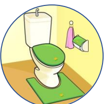
ご家庭の 台所・トイレ等