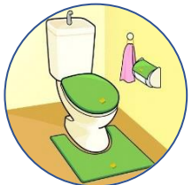
ご家庭の 台所・トイレ等